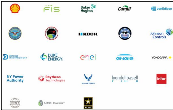
Klanten van C3.ai

Het bedrijf is in 2009 opgericht door Tom Siebel. Deze top ondernemer en miljardair heeft in 1993 Siebel Systems opgericht, die als eerste Customer Relationship Management (CRM) software op de markt bracht. Hij heeft dat bedrijf in 2005 aan Oracle verkocht voor $5,8 miljard. Door de opkomst van de cloud zag hij weer mogelijkheden voor een nieuwe strategie, waarin de hedendaagse cloud infrastructuur wordt gecombineerd met de slimme algoritmes van Artificial Intelligence om zo klanten beter te bedienen. De IPO van C3.ai was in december 2020. Het aandeel was toen erg populair en steeg de eerste dag met 174%. Daarna is het aandeel na een paar maanden stijging alleen maar gedaald. Dit terwijl de omzetten zijn blijven groeien.