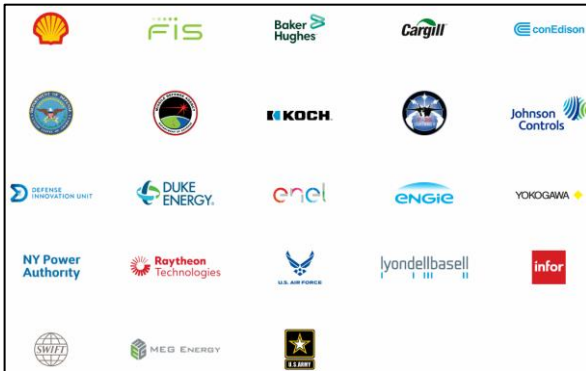
Klanten van C3.ai

Het bedrijf is in 2009 opgericht door Tom Siebel. Deze top ondernemer en miljardair heeft in 1993 Siebel Systems opgericht, die als eerste Customer Relationship Management (CRM) software op de markt bracht. Hij heeft dat bedrijf in 2005 aan Oracle verkocht voor $5,8 miljard. Door de opkomst van de cloud zag hij weer mogelijkheden voor een nieuwe strategie, waarin de hedendaagse cloud infrastructuur wordt gecombineerd met de slimme algoritmes van Artificial Intelligence om zo klanten beter te bedienen. De IPO van C3.ai was in december 2020. Het aandeel was toen erg populair en steeg de eerste dag met 174%. Daarna is het aandeel na een paar maanden stijging alleen maar gedaald. Dit terwijl de omzetten zijn blijven groeien.